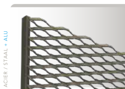
SUR / OP