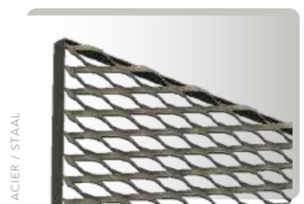
SUR TRANCHE / OP ZIJDE