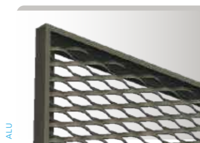
DANS / IN