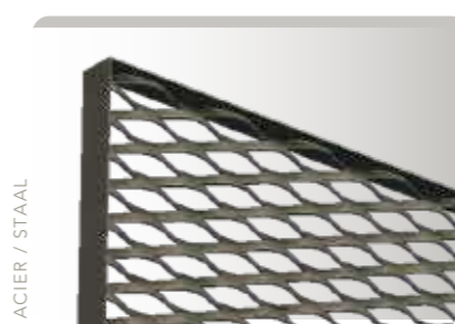
DANS / IN