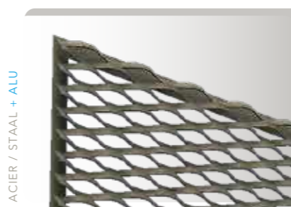
SUR / OP