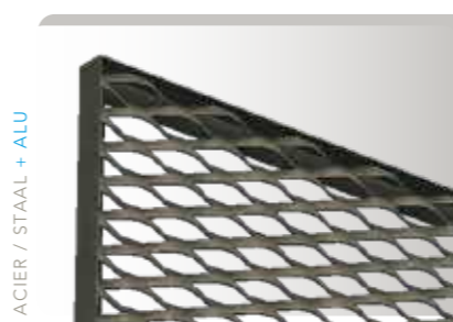
DANS / IN