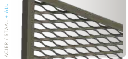
DERRIÈRE / ACHTER