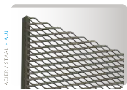
SUR / OP