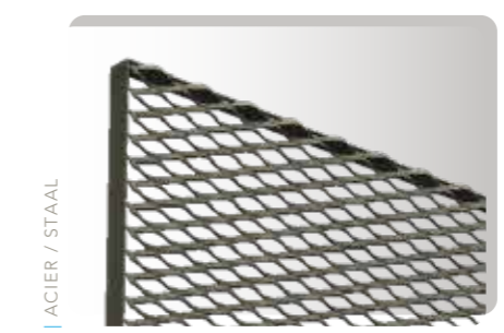
SUR TRANCHE / OP ZIJDE