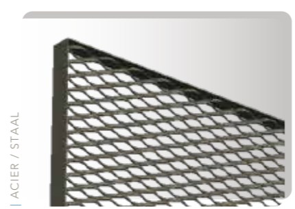
DANS / IN