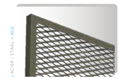
DERRIÈRE / ACHTER