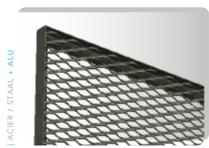
DANS / IN