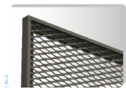
DANS / IN